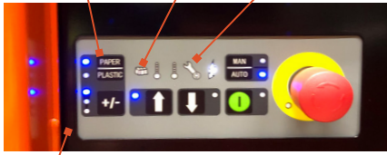
Säädettävä paalin koko

Materiaalinvalitsija pahville ja muoville Paalin täyttymisen merkkivalo Huoltomerkkivalo