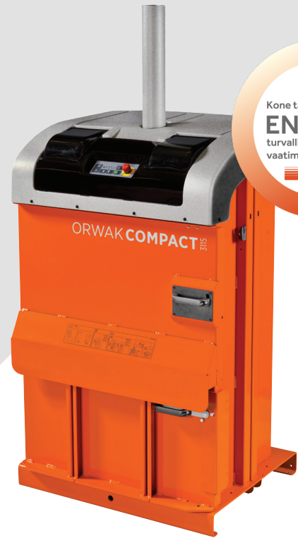
PAALIN PAINO PAHVI