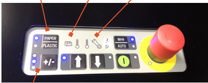
Säädettävä paalin koko

Materiaalinvalitsija pahville ja muoville Paalin täyttymisen merkkivalo Huoltomerkkivalo